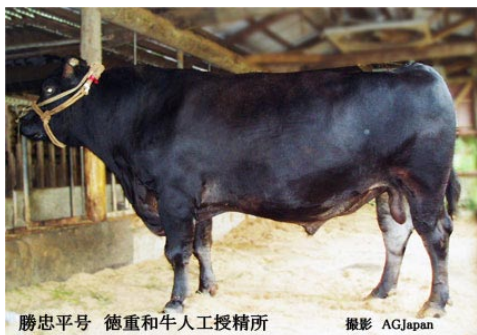
勝忠平号 徳重和牛人工授精所