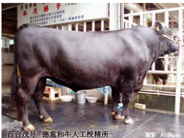
百合茂号 徳重和牛人工授精所