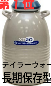
テイラーウォートン社 長期保存型 XT-20

XT-20は凍結精液・受精卵保存の標準的なサイズです。液体窒素の気化率はライバル商品を含めてトップレベルの性能です。