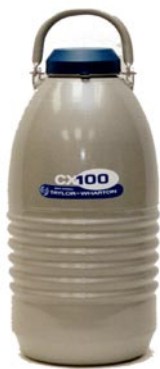
テイラーウォートン社 ドライシッパー CX100

「これはいいですね！万一倒れても液体が漏れないから、安心して受精卵を輸送できるようになりました。」