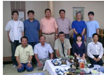
北海道先行販売に先立ち、販売元・受入先の農家・獣医師・移植師同士の打ち合わせを北海道にて行いました。