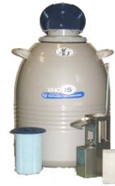
テイラーウォートン社 大量保存容器 VHC35

VHC-35はAGJAPANオリジナルの角型キャニスターを使用することで、在庫管理が容易にできます。精液が大量に保存でき、液体窒素の気化が少ないため、全国のAIセンターで好評です。