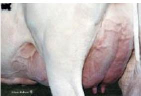
娘牛 マースソーサ

母である「スパイシー EX-90」は、年間乳量28,118kgという全米記録を樹立、また同時にタンパク質第3位にもなったスーパーカウであり、ソーサの実力を血統的に支えます。