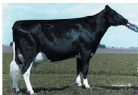
娘牛 エルスパードソーサ