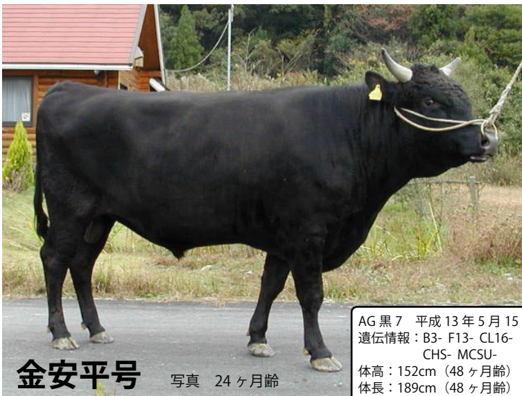
金安平号 写真 24ヶ月齢 AG黒7 平成13年5月15日生 遺伝情報: B3- F13- CL16- CHS- MCSU- 体高: 152cm (48ヶ月齢) 体長: 189cm (48ヶ月齢)